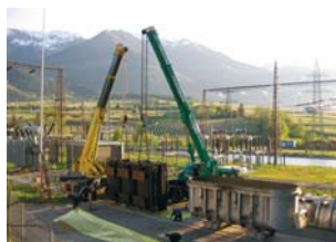
Lo smaltimento di una centrale dismessa

Da piccola realtà familiare a leader in Italia: VI.BI. Elettrorecuperi srl ridà una seconda vita alle apparecchiature elettriche fuori uso, nell'assoluto rispetto per l'ambiente. In particolare l'azienda è specializzata nello smaltimento e bonifica di trasformatori di tensione e nello smantellamento di gruppi elettrici di produzione. Grazie a un lavoro di squadra collaudato nel corso degli anni, oggi VI.BI. Elettrorecuperi srl è in grado di offrire al cliente un servizio veloce e preciso, mettendo sempre al primo posto la sicurezza dei lavoratori e il rispetto della normativa ambientale. Certificata ISO 9001, 14001 e 18001, si avvale di autorizzazioni e mezzi che le consentono il ritiro e il recupero di apparecchiature contenenti PCB o fibre libere di amianto e lo smantellamento di macchine di grandi dimensioni. Un team operativo di