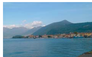
Vista del lago d'Iseo

Da oltre 30 anni, Studio Casa Iseo, è un riferimento importante nel mercato immobiliare del lago d'Iseo e della Franciacorta,