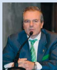
Daniele Molgora, presidente della Provincia di Brescia

La provincia di Brescia è un luogo dal richiamo internazionale in materia di eccellenze e di produttività; è un territorio ricco di cultura, di storia e di attrazioni turistiche. Brescia significa lavoro, forza produttiva; significa "imprese" la cui efficienza è apprezzata in tutto il mondo. Per questo la Provincia di Brescia ha creato un marchio di territorialità, il "Made in provincia di Brescia", un Marchio d'Impresa che può essere utilizzato in ogni settore: dalle aziende agricole all'industria manifatturiera, dai servizi del terziario avanzato ai piccoli artigiani, ai liberi professionisti. "L'obiettivo è solo uno - ha dichiarato il presidente On. Daniele Molgora - favorire la crescita del mercato interno, valorizzando il lavoro dei bresciani e sostenendo quelle aziende che aderiranno a